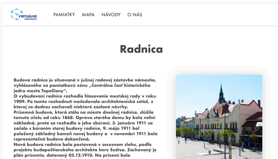
náhľad stránky pamiatky