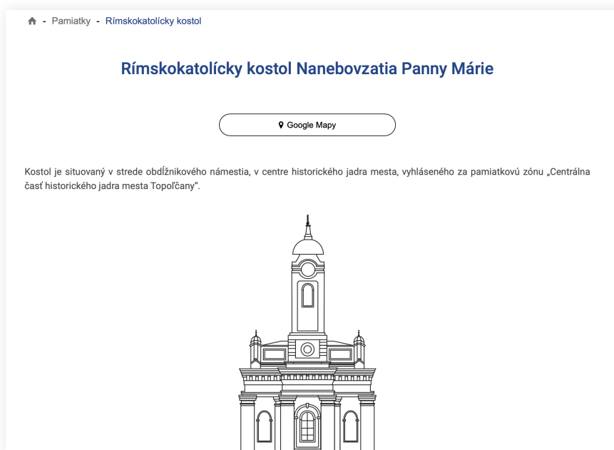
náhľad stránky pamiatky