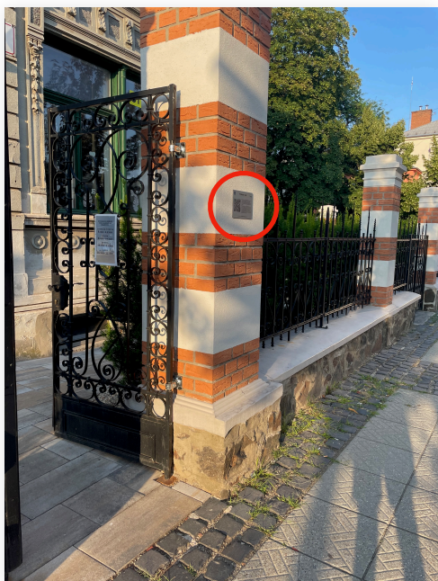
QR kód umiestnený na pamiatke