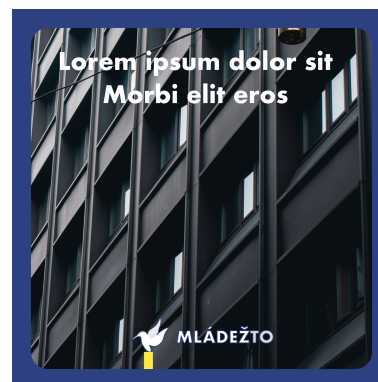
modrý príspevok (var. 2)