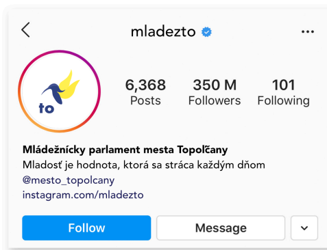
náhľad profilu na Instagrame