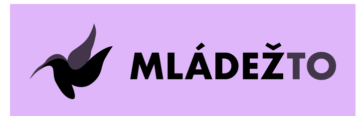
dodržiavanie ochranej zóny

*fotografie na banneroch patria pod Unsplash copyright license *na banneroch sa používa náhodne generovaný text Lorem ipsum