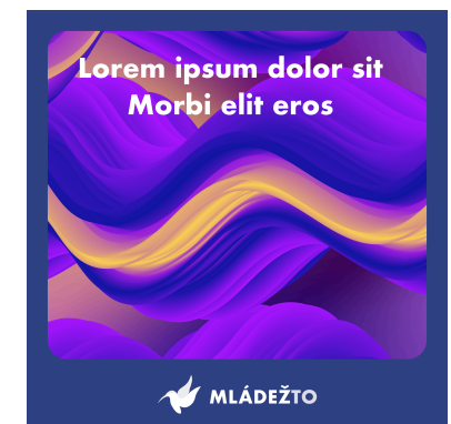
modrý príspevok (var. 1)