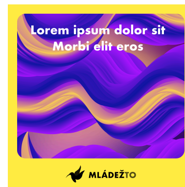
žltý príspevok ( var. 1)